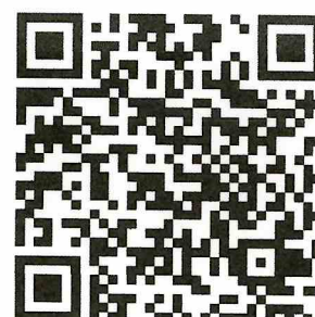
สมัครสอบ

หมายเหตุ: หากโรงเรียนตรวจสอบพบว่า เอกสารหลักฐานที่แนบไม่ตรงกับความจริง หรือเป็นเท็จถือว่าการสมัครเป็นโมฆะ และมีความผิดตามกฎหมาย